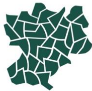
RHÔNE - ALPES

Once the preserve of the elite, this dessert was democratised in the 20th century, thanks to the Angelina patisserie. A true ode to autumnal flavours, Mont-Blanc oscillates between sweetness and woody nuances, to the delight of lovers of gourmet traditions.